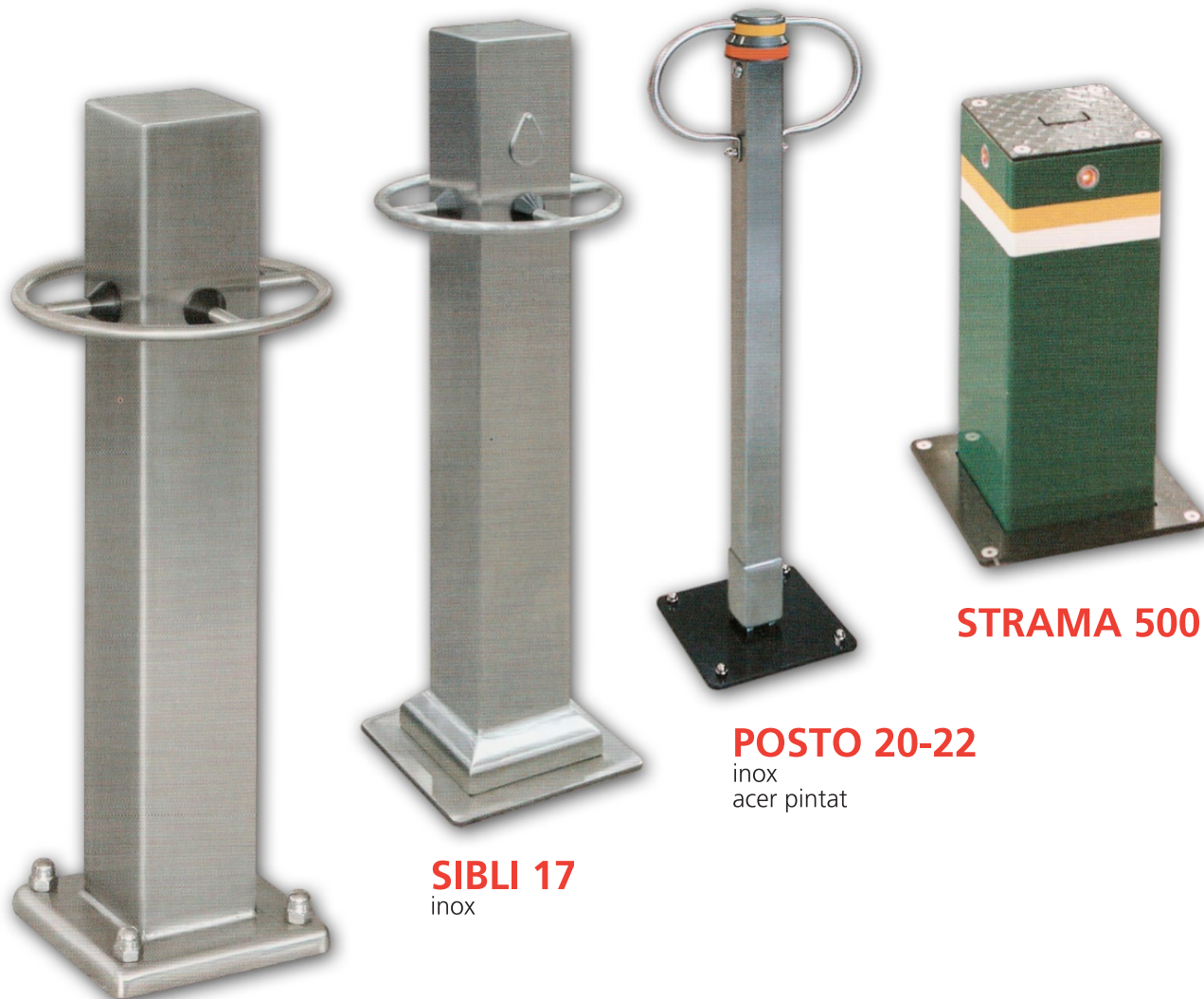
SICU 18 inox